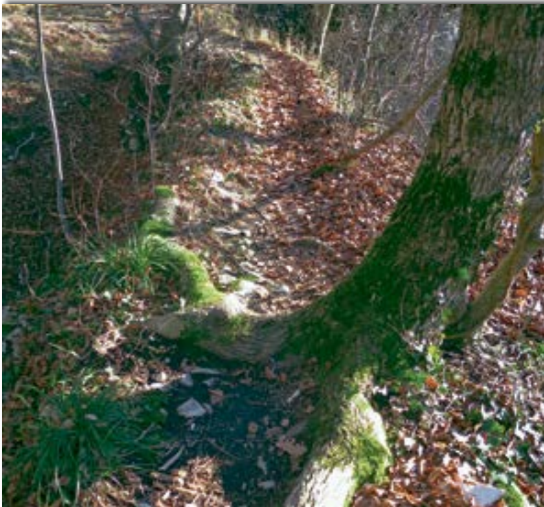
Kein Weg zum Begehen mit Sandalen. Hier geht jeder Wanderer auf eigenes Risiko! Wurzeln sind eine typische Gefahr von Wanderwegen.