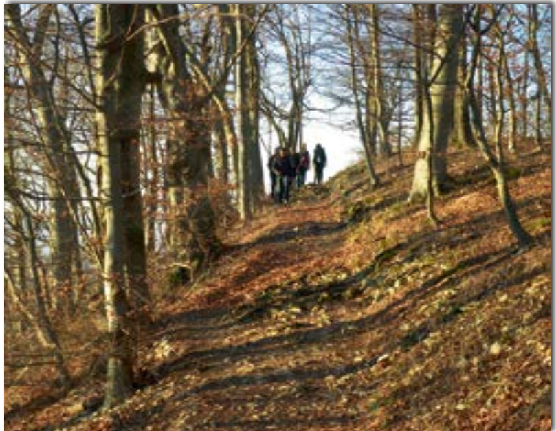
Typischer Wanderweg in der Eifel. Gutes Schuhwerk ist hier eigentlich selbstverständlich.