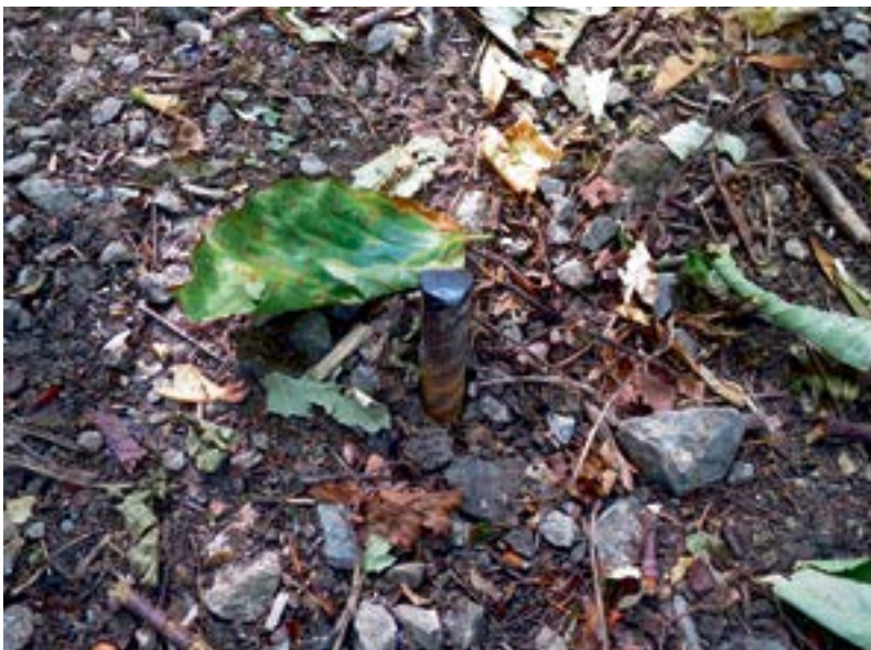
Kaum zu erkennende Stolperfalle – ein Eisenbolzen einer längst vermoderten Holzterrasse inmitten des Wanderwegs.

Unsicherheiten gibt es bzgl. „Waldwegen“, die ja – von Wildwechsellern abgesehen – in der Regel künst-