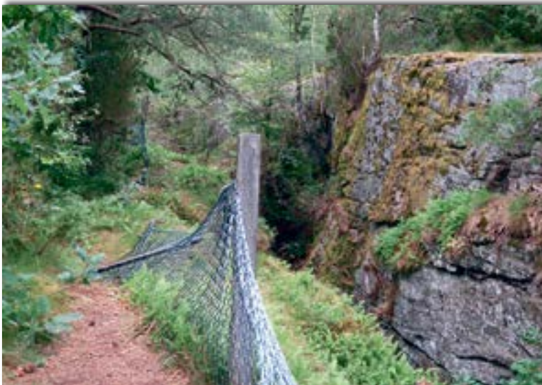
Wer eine Absperrung – wie hier neben einer zehn Meter tiefen Schlucht – baut, muss dafür sorgen, dass sie stets in Ordnung ist.