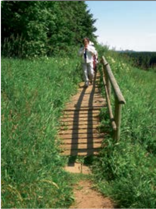
Dieser Steg über feuchtes Gelände bietet mit seinem Geländesicherheits.